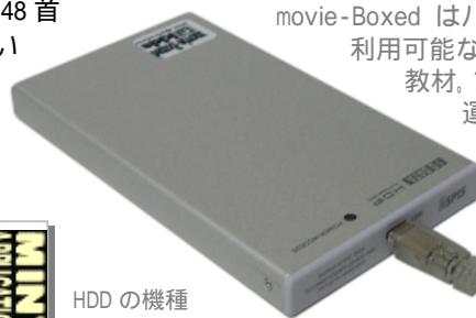
HDD の機種 外觀は変更することがあります

ポータブル HDD に、ソフトとコンテンツを収納 (対応 OS:Windows) movie-Boxed はパソコンに USB 接続するだけで 利用可能なオールインワンユニットの電子 教材。プロジェクトと併用すると教室 運営が見違えるように引き締ま って楽しくなります。